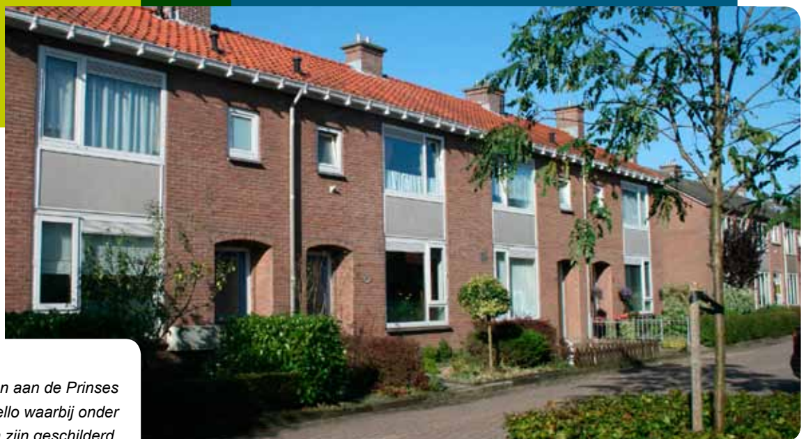
De woningen aan de Prinses Margrietstraat in Twello waarbij onder andere de voordeuren zijn geschilderd.

In het volgende magazine treft u een overzicht van de onderhoudsplanning voor 2012.